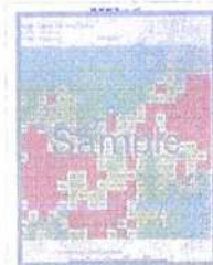
落雷マップサンプル